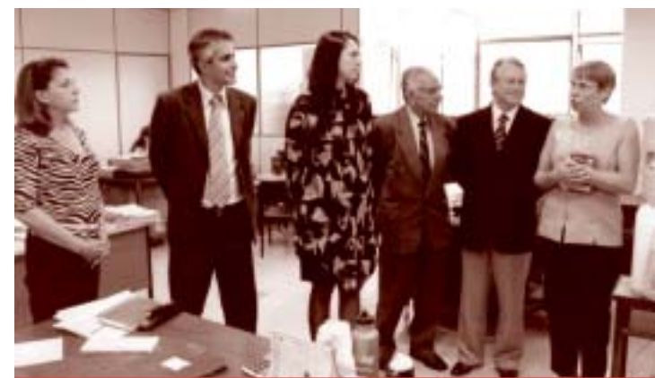
Diretoria do SINDIPROESP ouve as queixas dos procuradores da PJ do DER