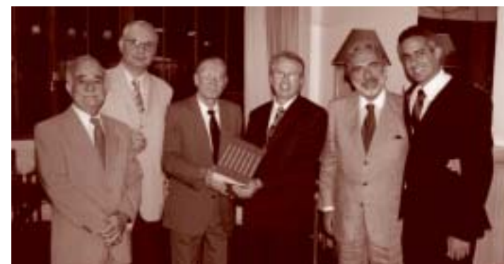
O presidente Ademar de Barros recebe os livros de autoria de Armando Marcondes Machado Junior (primeiro presidente do SINDIPROESP)

Os volumes doados, que valorizam de forma expressiva o acervo da biblioteca do Sindiproesp, encontram-se à disposição dos procuradores sindicalizados na sede da entidade.